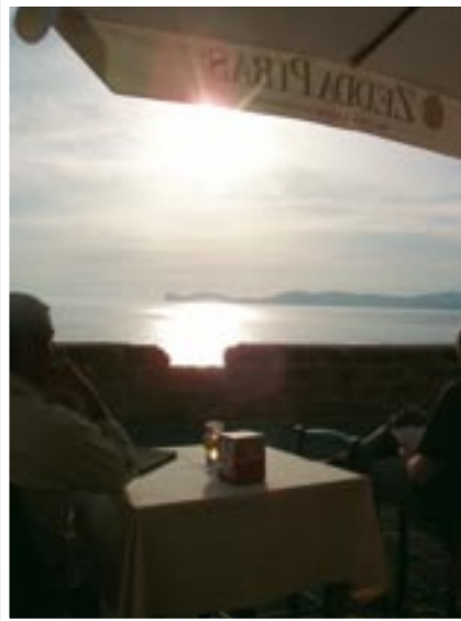
Die Sonne lässt man am besten über der Bucht von Alghero untergehen, während man in einem der Fischrestaurants auf der Hafenufer die Nachbesprechung des Flugtages macht.