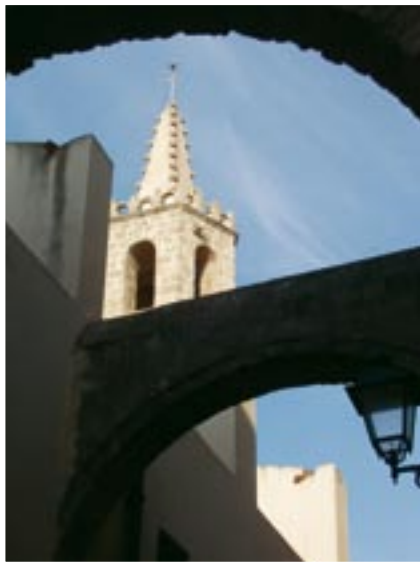
Nach dem Flug bieten sich die engen Gassen von Alghero für einen kleinen „Aus-Flug“ an.