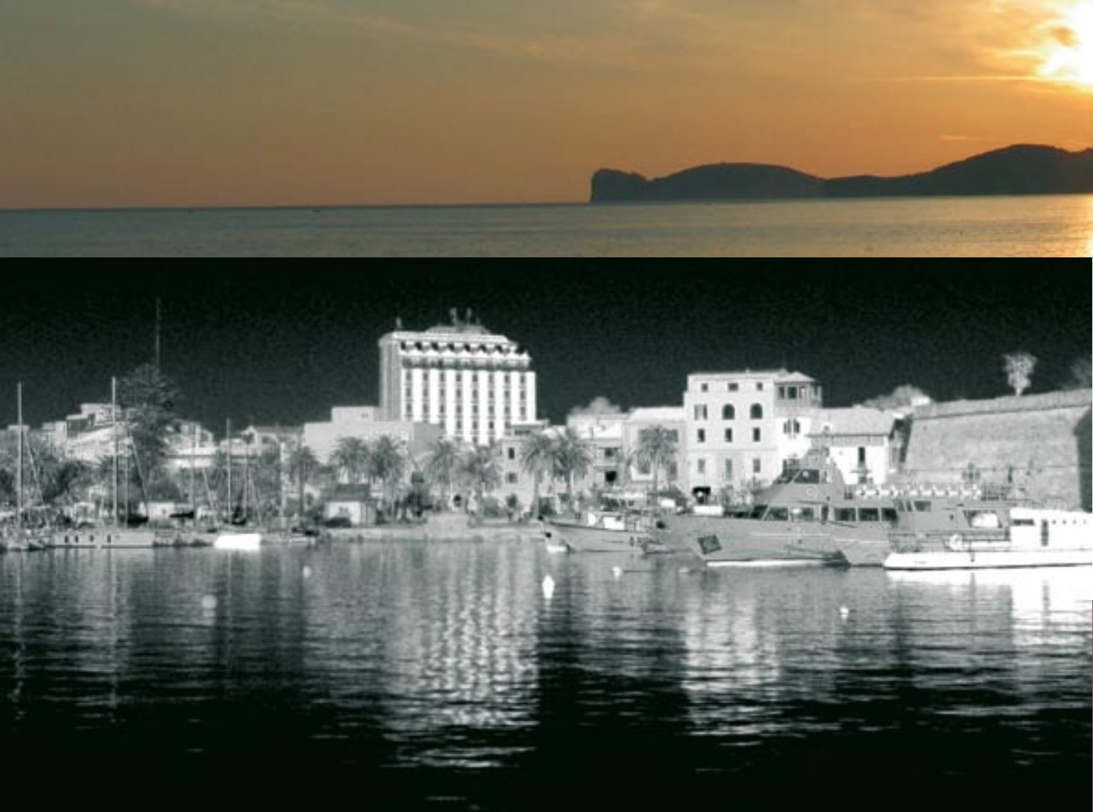
Schwarz-weißer Blick auf den Hafen.

tung Küste (die Bucht von Alghero sieht man, wenn man leicht nach rechts blickt), mit ausreichend Platz für zumindest einen Schirm und einer genau richtigen Steigung von vielleicht 45°. Hier ist es einfach nur schön und absolut still. So wartet man dann auch gerne, bis die geeigneten Wind- oder Thermikbedingungen eingetreten sind. Eigentlich bietet sich La Siesta als Start für Soaringflüge an. Da der Hang nicht ganz so steil ist, braucht es allerdings schon etwas Wind. Der am Startplatz messbare Windvektor sollte bei ca. 20-25 km/h liegen. Der von See her wehende Bodenwind sollte also nicht unter 8 Knoten liegen. Von La Siesta kann ca. 30 km entlang der Küste bis Bosa gesoart werden und es dürfte sich um eines der weltweit wohl schönsten Soaringgebiete handeln. Doch zumindest ab April sind auch Thermikflüge und kombinierte thermo-dynamische Flüge am frühen bis späten Nachmittag gut möglich, die anschließend von einer Toplandung gekrönt werden können, wenn es, wie gesagt, nicht zu